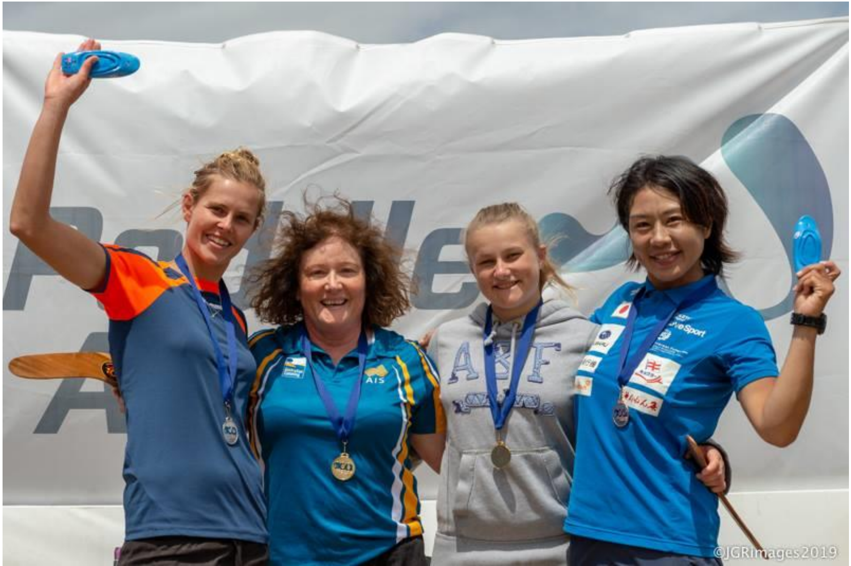
オセアニアチャンピオンシップス表彰式